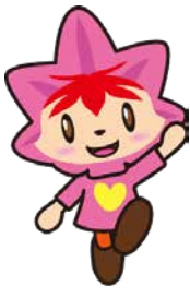
協会けんぽ広島支部 マスコットキャラクター 健康 かえで

協会けんぽでは、健康保険を使用して診療を受けられた加入者の皆様に、医療費を確認していただき、健康保険事業の健全な運営を図るために、年に一度「医療費のお知らせ」を送付しています。