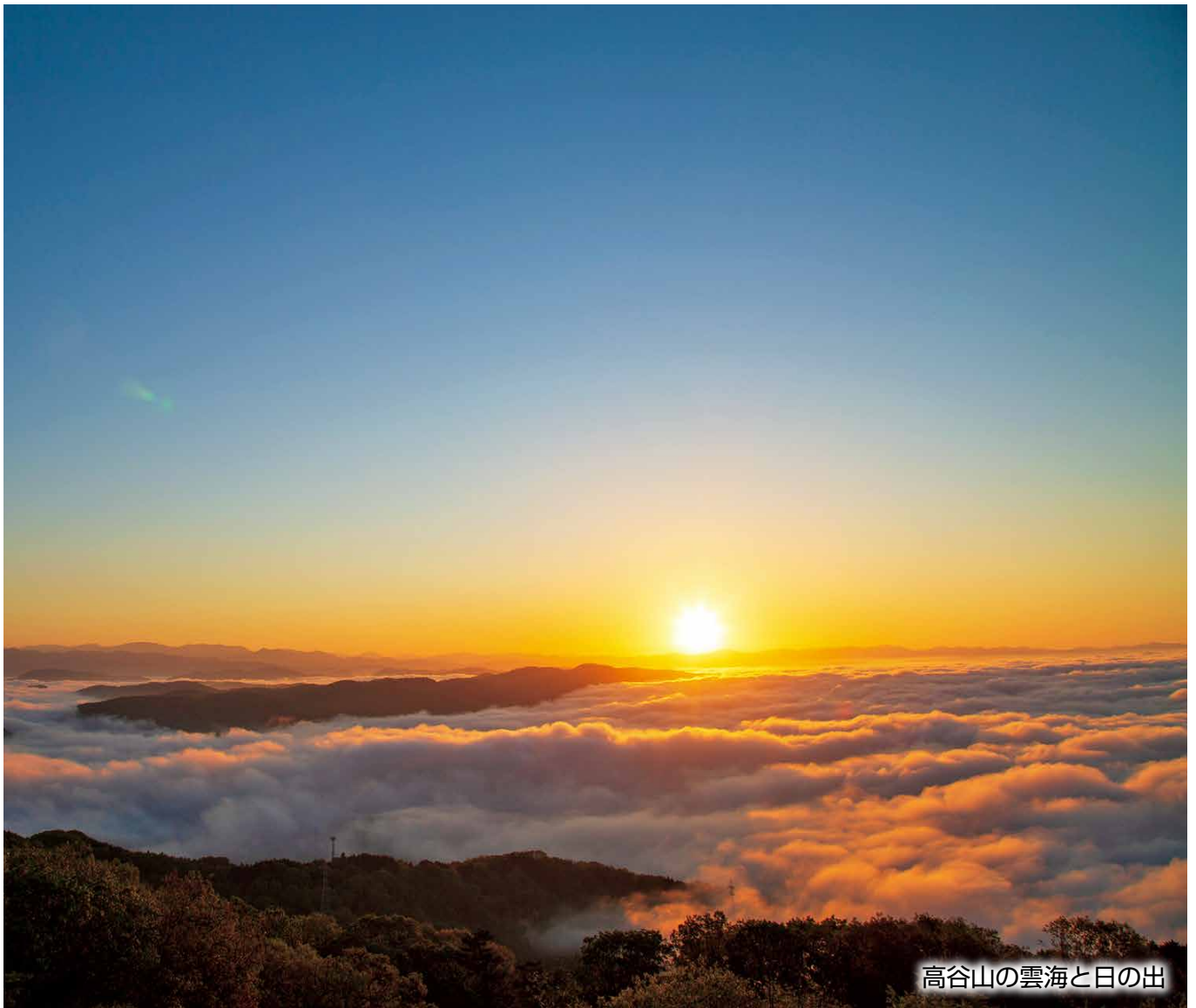
高谷山の雲海と日の出