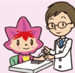
協会けんぽ広島支部 マスコットキャラクター 健康かえて

協会けんぽでは、加入者の皆さまにご自身の治療等にかかった医療費について確認していただき、健康保険事業の健全な運営を図るため、年1回「医療費のお知らせ」をお送りしています。