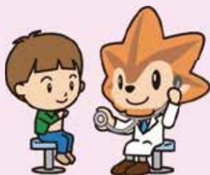
協会けんぽ広島支部 マスコットキャラクター 健康いろは