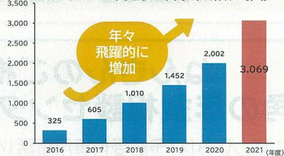
ひろしま企業健康宣言事業所数の推移