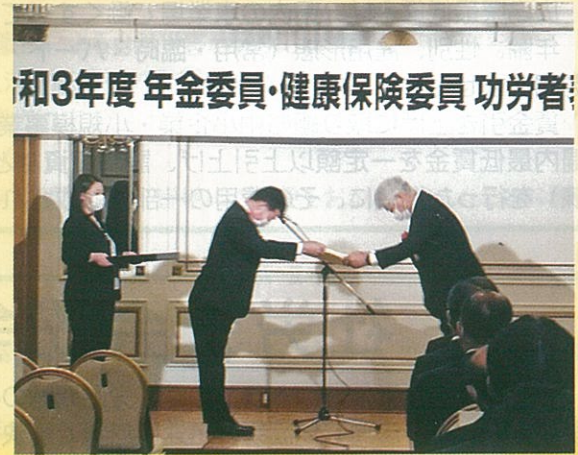
令和3年度 年金委員・健康保険委員 功労者