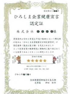
ひろしま 企業健康宣言 「認定証」 (イメージ)